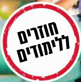
שלי שוקר, משפט וממשל