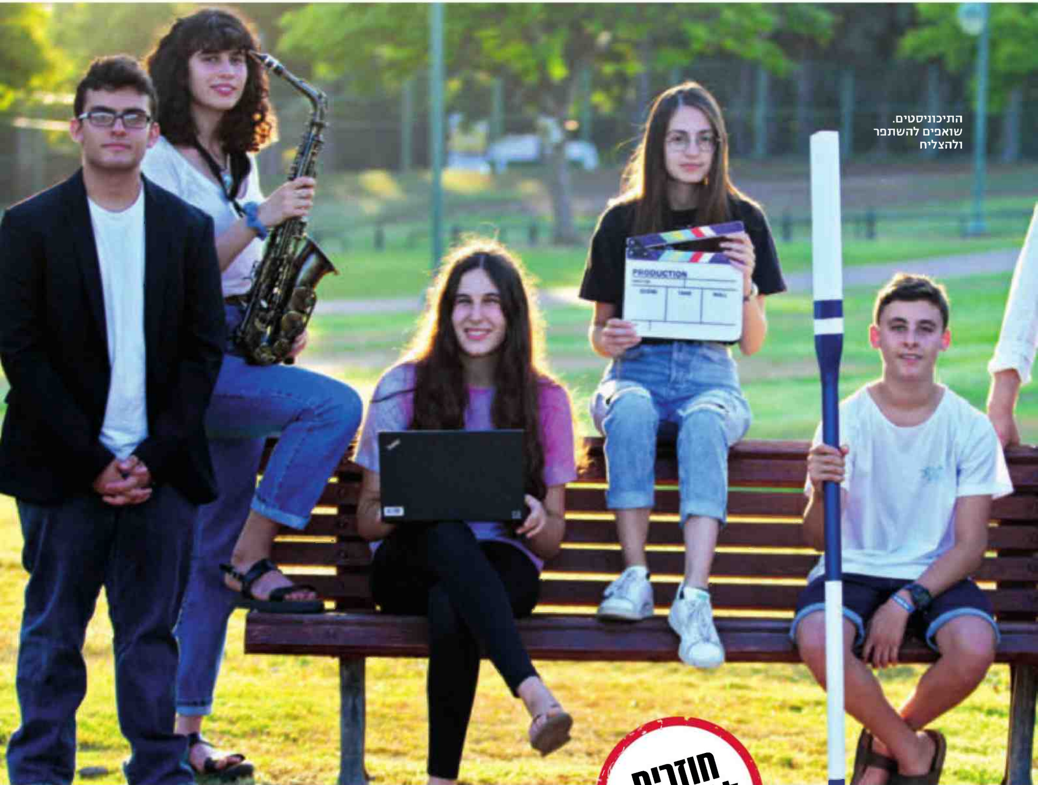
התיכונים החדשים שואפים להשתכר ולהצליח