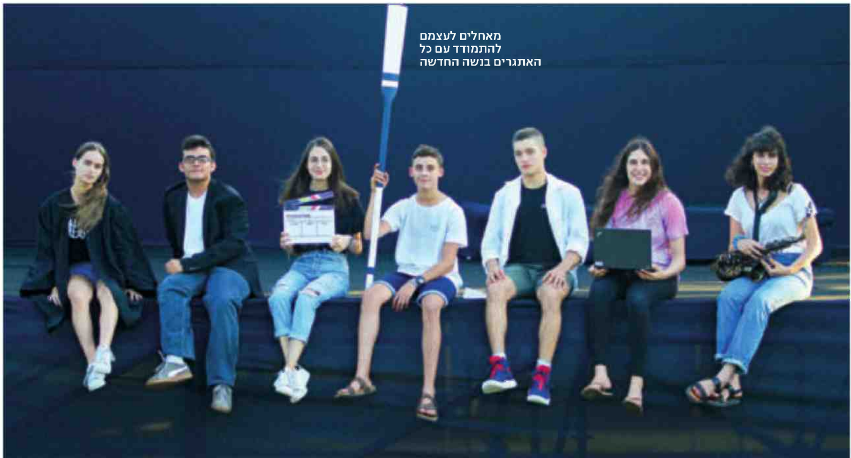
מאחלים לעצמם להתמודד עם כל האתגרים בנשה החדשה