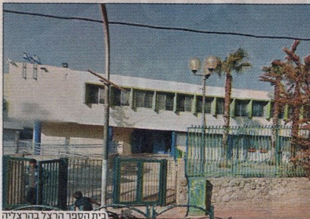
בית הספר הרצל בהרצליה