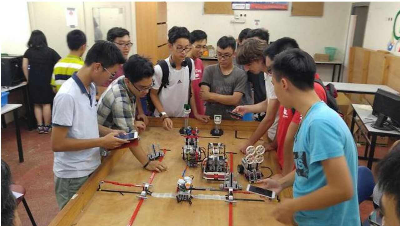
"הווייטנאמים הפגינו יכולות בלתי רגילות, רוח של חדשנות ותשוקה"

תהליך ההכשרה כלל שלושה שלבים מרכזיים. השלב הראשון היה סדנת רובוטיקה שנתנה להם כלים בתחומים כמו מידול בתלת ממד, מכניקה ובנייה, מערכות ועיצוב. התלמידים למדו והרכיבו רובוט "חי" ומתפקד מבחינת חשיבה הנדסית. בשלב השני הם למדו ייצור רובוטים. ב- LEGO LEAGUE השלב השלישי הוא מסלול סטארט-אפים - התלמידים קיבלו כלים לפתיחת סטארט-אפ, כמו שיווק, סקר שוק, פיצ'ינג ועוד.