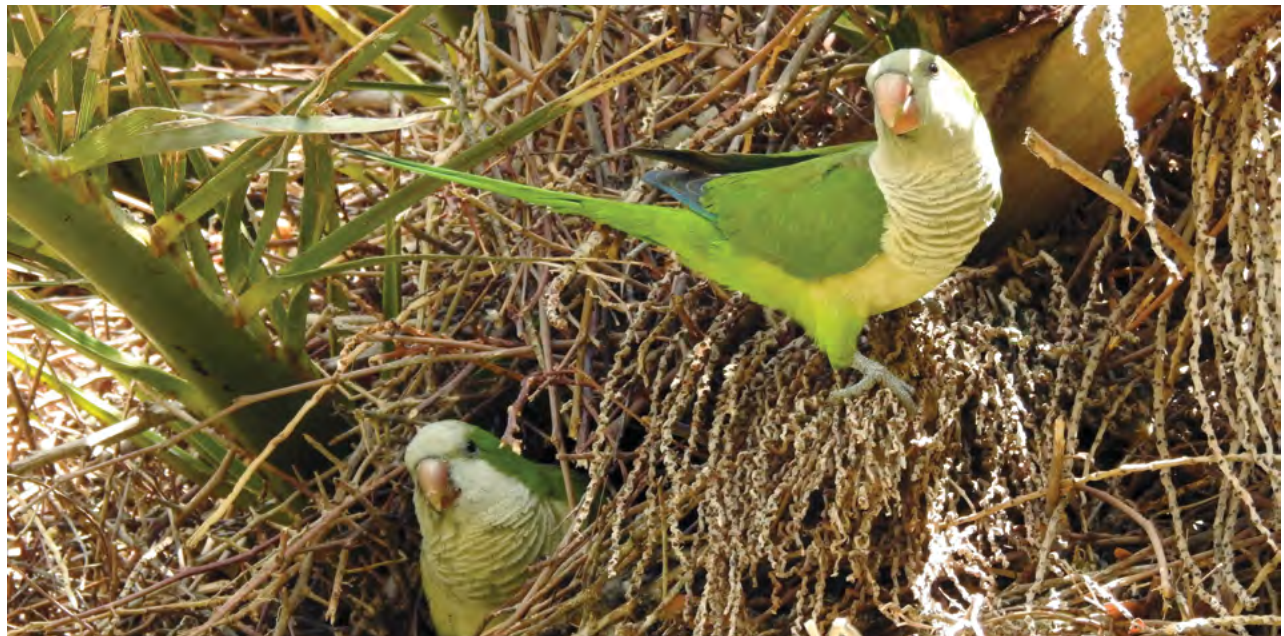
שני תוכים נזיריים בפתח קן, קיבוץ געש