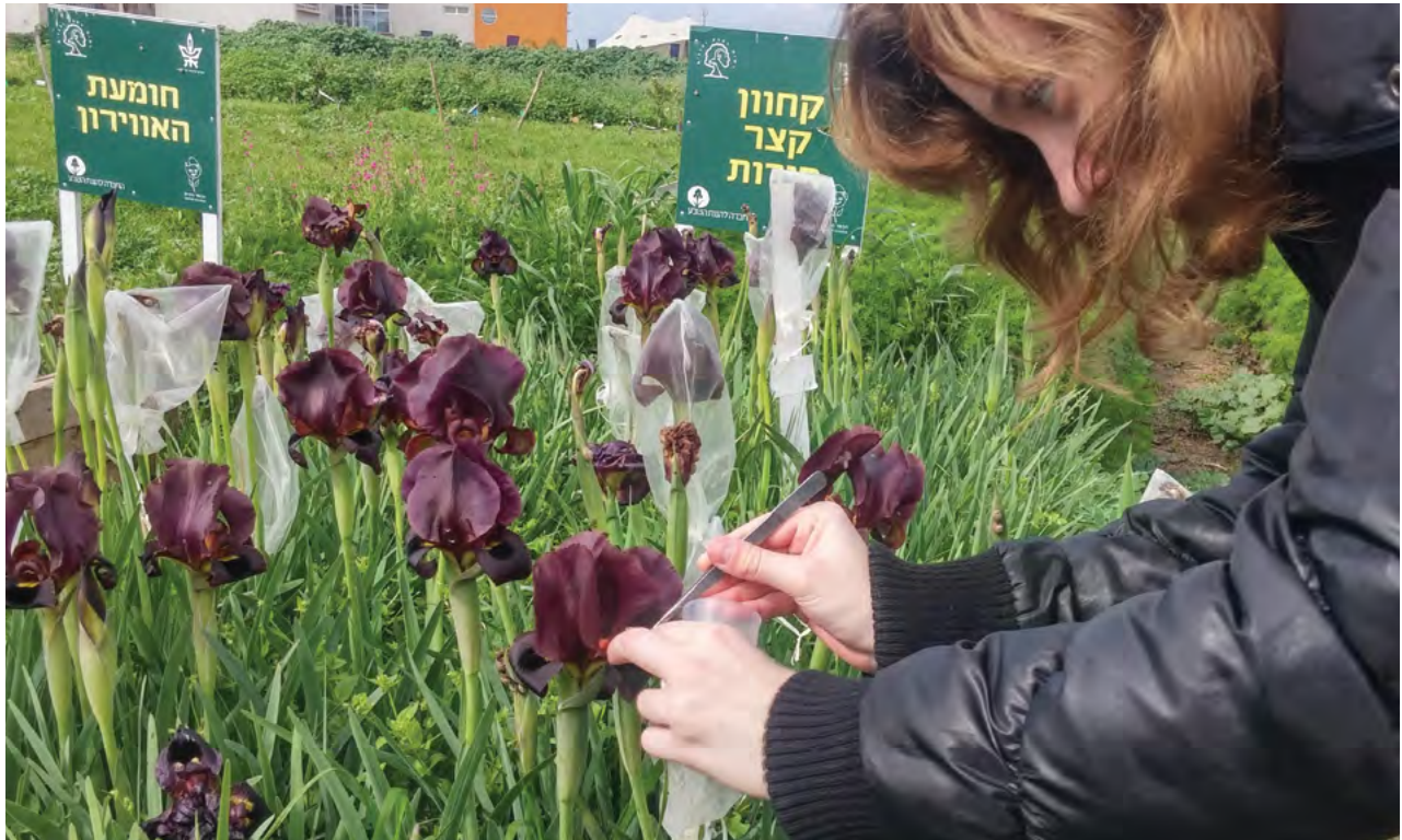
ניסוי בהאבקה משלימה של צמחים בסכנת הכחדה, המגודלים בגן המקלט שבכפר הירוק. במסגרת ניסוי לבגרות מצאו תלמידי הכפר הירוק שיטת מחסור במאביקים טבעיים לאירוס הארגמן, ונעזרו בהאבקה ידנית כדי להגיע לאחוז גבוה של הלקטי זרעים

העיקריות לסכנה המרחפת מעל בתי הגידול הללו נובעות מלחצי הפיתוח והשימוש החקלאי הנרחב בקרקעות במישור החוף. מוערך כי פחות מ-1% משטחי החמרה והכורכר המקוריים נותרו כשטחים פתוחים שאינם מעובדים. [3] בעקבות הרס בתי גידול אלה נכנסו 49 מיני צומח המאפיינים את רכסי הכורכר וגבעות החמרה לרשימת הצמחים בסכנת הכחדה בישראל. [4]