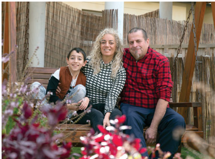
"הדבר הכי מתגמל נפשית"

ואז צצה הזדמנות. דנה, שעבדה אז כמורה בבית הספר הממלכתי בקיבוץ געש, שילבה בתוכנית הלימודים פרויקט של משאבים, באמצעות מיחזור קפסולות של מכוניות קפה אשר הפכו לתכשיטים ומכרו בירידים, ארגנו מפגש עם ילדי הביר משפחתונים, פנימיות במודל משפחתי, שמנהלת עמותת "המפעל להכשרת ילדי ישראל" ב-14 מקומות בארץ. ארבעה נ