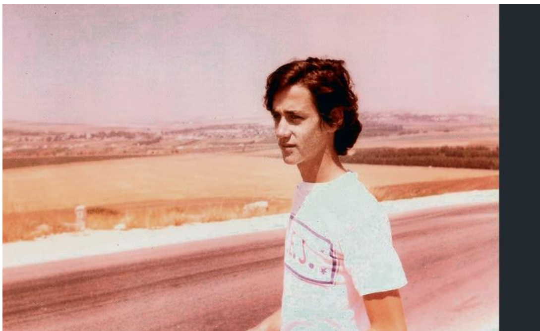
כנער בכפר אחים. למד בבית ספר דתי

"אף אחד לא מושלם. אבל אני לא מצאתי בבני דברים לא טובים ששווה להזכיר אותם. הוא איש בלתי רגיל. ואני אומר את זה אחרי עשרות נסיעות משותפות לחו"ל, מאות פגישות ואלפי שעות עבודה".