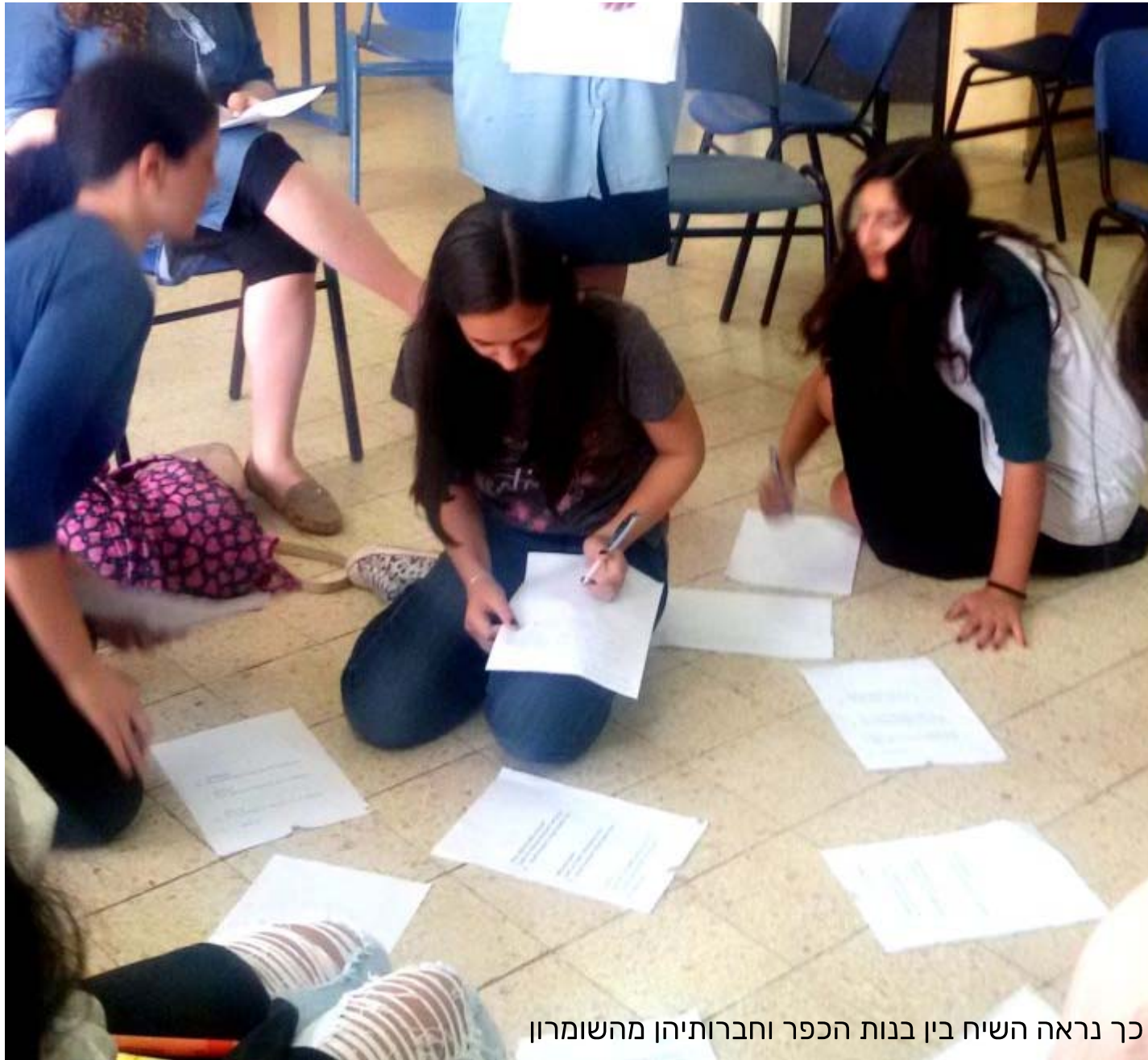
כך נראה השיח בין בנות הכפר וחברותיהן מהשומרון