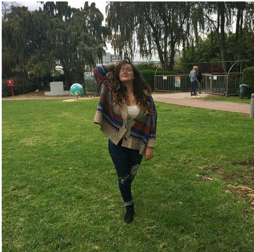
אופיר © פרטי

"בעקרון אני לא ממש עובדת לצד אבא אבל זאת הרגשה מאד טובה לעבוד בסביבה מוכרת, אך הסביבה מאוד טובה בלי שום קשר לעובדה שאני 'הבת של הבוס'. במסגרת העבודה בטריא היא עובדת בתחום הפרסום והשיווק עליו היא מספרת: "אני עובדת בתחום הפרסום והשיווק. כרגע אנחנו עובדים על פרוייקט שמטרתו הסופית היא ליצור פטלפורמה שבה גם בני נוער יוכלו להלוות כספים באופן עצמאי. מה שאנחנו עושים בפרוייקט הוא לחקור איך בני נוער חוסכים ועושים כסף כיום."