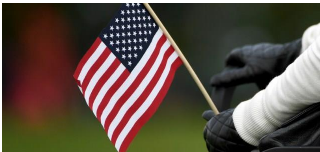
תחרות בארצות הברית

"במסגרת התחרות היה צריך להגיש פרויקט עזרה לקהילה, אנחנו כקבוצה בנינו ערכה שהופכת כיסאות גלגלים רגילים לחשמליים במעט כסף ומשאבים. בזכות הערכה שבנינו, לאחר תחרות הרובוטיקה בישראל עלינו לגמר בדטרויט, ארצות הברית, שם זכינו בפרס חדשנות התוכנה שמייצג את זה שהרעיון שלנו היה יותר חדשני וחכם משל האחרים."